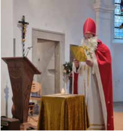
„Der Mann im roten Mantel“ Der Nikolaus erzählt seine Geschichte im Familiengottesdienst in Flossen- bürg.