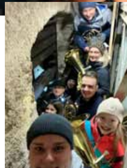
Turmbläser in Floß am letzten Tag des Jahres