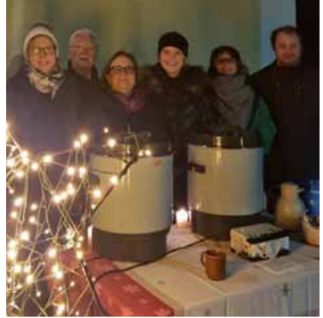
Ökumenisches „Adventsfenster“ Dankbare Gastgeber an der Pankratius- Kirche.